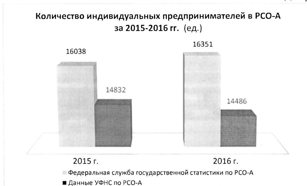
Диаграмма № 1

В настоящее время индивидуальные предприниматели, занятые в малом бизнесе, выбирают такие специальные налоговые режимы, как упрощенная система налогообложения (самый распространенный и популярный в малом бизнесе тип налогового режима), единый налог на вмененный доход и патентную систему налогообложения.